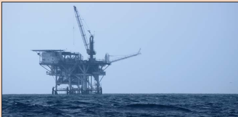
Σελ. 22 Αναβάθμιση των ενεργειακών υποδομών της ΕΕ